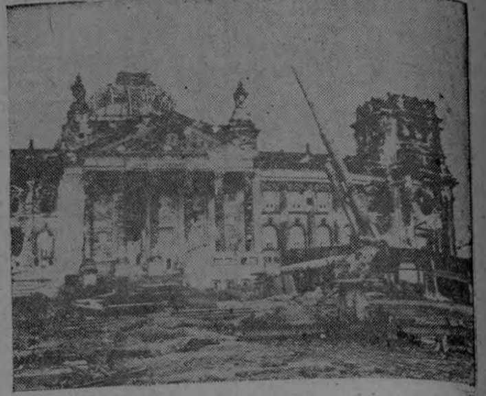
Ruinas del Reichstag alemán según se veían cuando las tropas estadounidenses entraron en Berlín para hacerse cargo de la administración de una sección de la ciudad. En este edificio es donde los nazis se apoderaron del poder y llevaron a Alemania a la ruina.